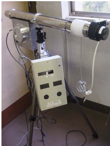
新開発の大気イオン濃度測定器

講演会に関するお問い合わせは、信州建築構造協会(fax 0263-33-8494)までお願いいたします。